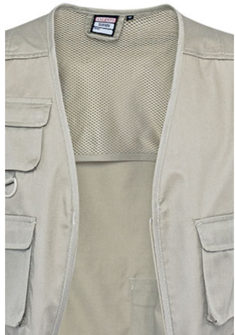
Détail filet intérieur dans le haut du dos