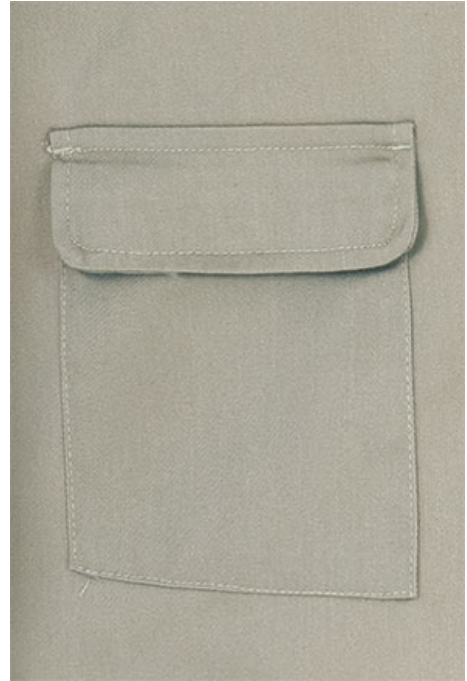
Détail poche avec rabat en bas du dos