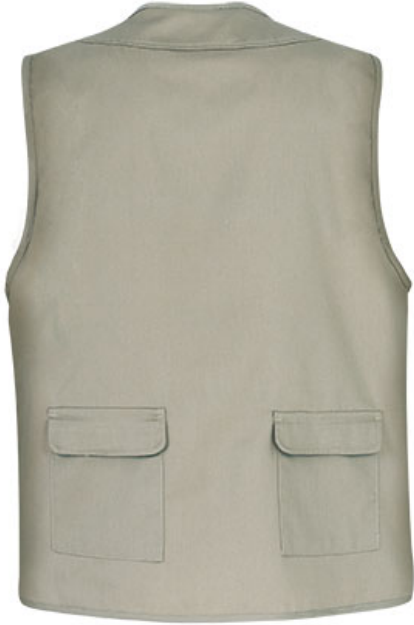
Vue de dos du vêtement