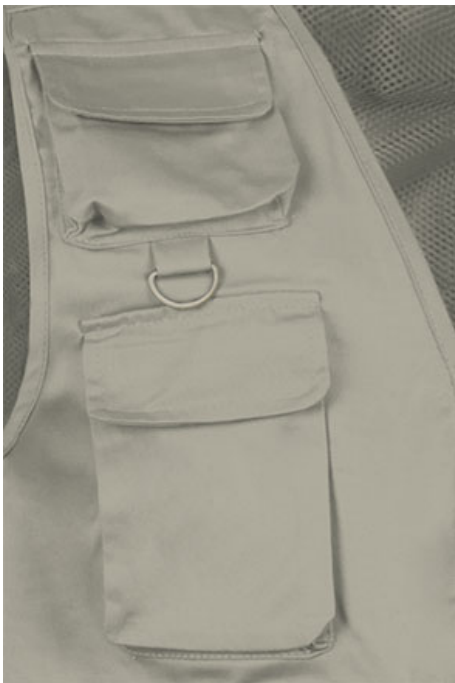
Détail poches et anneau poitrine côte droit